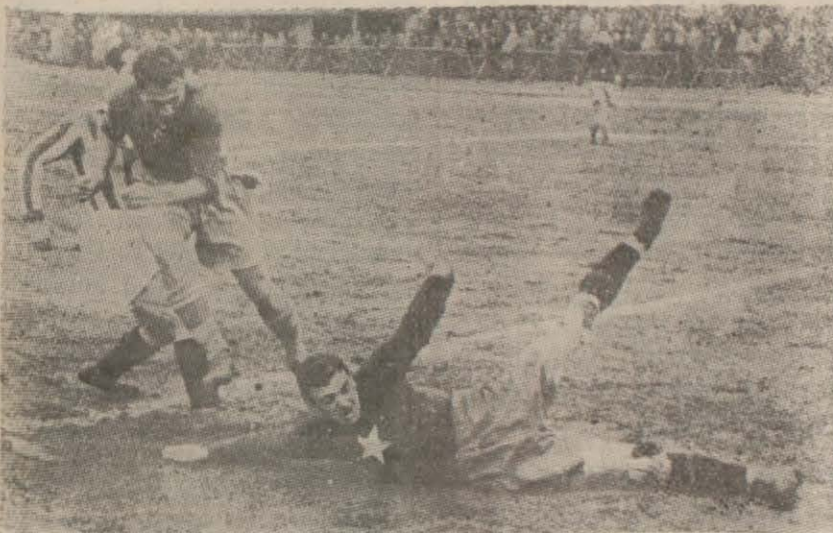
Bugünkü maçtan bir enstantane (Yazısı 2 inci sayfada)

Masarlar İstanbul (B) muhtelitini 3-1 yendi